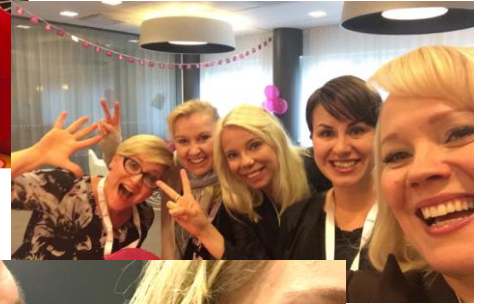
Kokemuksia etätyöstä / Katsontoja 3